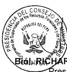
Biol. RICHARD E. BUSTAMANTE M. Presidente Ejecutivo Organismo de Supervisión de los Recursos Forestales y de Fauna Silvestre - OSINFOR