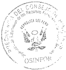
BIÓL. RICHARD E. BUSTAMANTE M. Presidente Ejecutivo Organismo de Supervisión de los Recursos Forestales y de Fauna Silvestre-OSINFOR